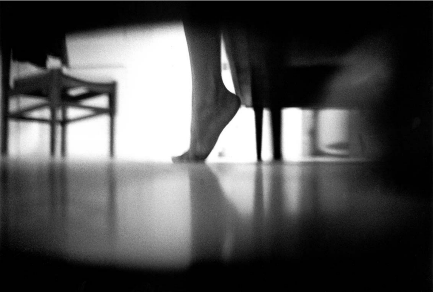
Paul Schneggenburger, »Die Nachbarin«, 2004 3er Serie auf Barytpapier, auf Aluminium kaschiert, gerahmt und verglast, je 70 x 105 cm

Paul Schneggenburger bewegt sich in seiner Arbeit um eine Positionierung zwischen den Bereichen der Reportage und konzeptionellen Bereichen der Fotografie. In seinen Bildern werden zeitliche Abläufe, welche sich oftmals über Stunden und andere in Sekunden vollziehen, sichtbar.