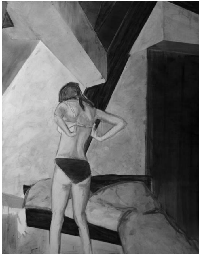
Robert Muntean »o.T.«, 2005 Öl auf Leinwand, 190 x 160 cm