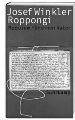
Requiem für einen Vater 164 S. Geb. € 17,30 (A) (September)

In immer neuen Anläufen schreibt Josef Winkler von des Vaters Leben, Tod und Begräbnis – ein Sterbe- und Auferstehungsfest für den Mann, der überlebensgroß Winklers Kindheit beherrschte.